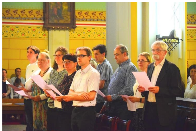
A képviselőtestületi eskü megújítása

Amikor az utolsó napon a köszönő ajándékokat adtam át sorban, igazán nagy hála volt bennem mindazok iránt, akik mindezt küldetésüknek érezték. Sok kis csomag volt – mert sokan tudták, érezték, hogy így lesz igazán közös az ünnep.