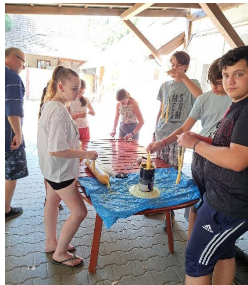
gyertyaöntés a nyári táborban

csütörtök este 18.30-kor, kb. másfél óra időtartamban.