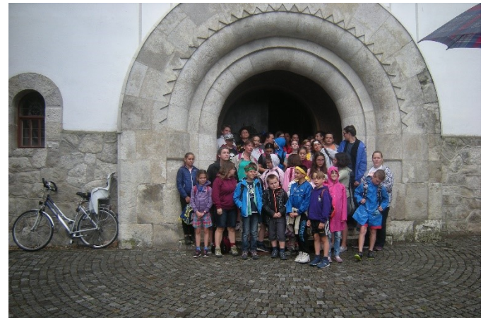
A zebegényi templom kapujában