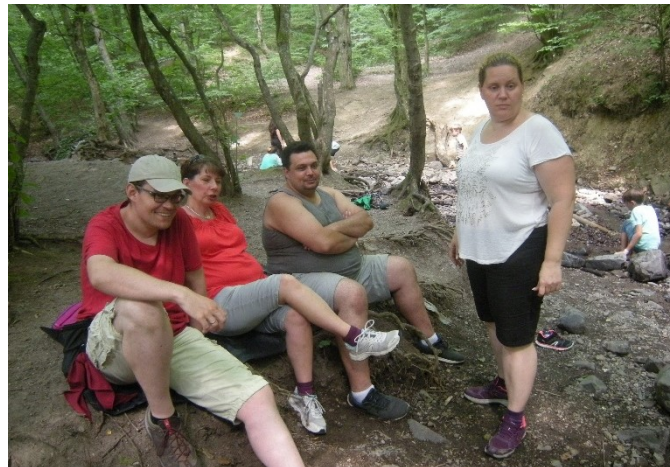
A felnőtt táborvezetők pihennek....

Csütörtökön ismét Királyrétre mentünk, de most odafelé busszal utaztunk, visszafelé pedig gyalogosan kirándultunk. Jó hosszú túra volt, mire hazaértünk nagyon elfáradtunk, de csak egy kicsit tudtunk pihenni, mert indultunk is a ciszterci nővérekhez szentmisére.