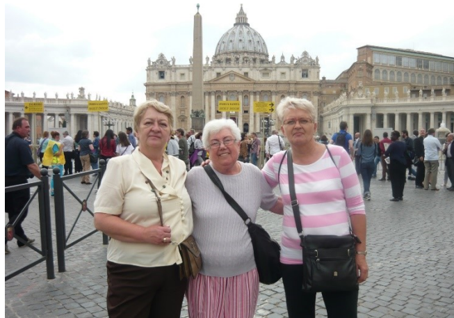
Középpont Marika: a római Szent Péter téren.

meg, nagyon sokat beszélgettünk imádkoztunk.