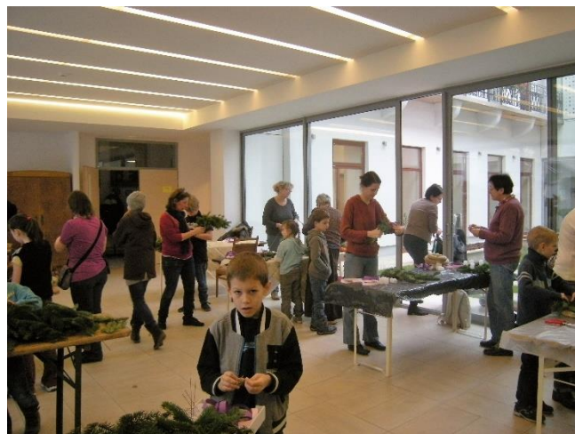
Adventi koszorúkötés a plébánián