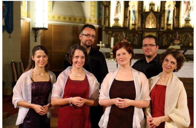
Plébániánk Navicella kórusa, az „Ars Sacra” fesztivál fellépésén templomunkban.