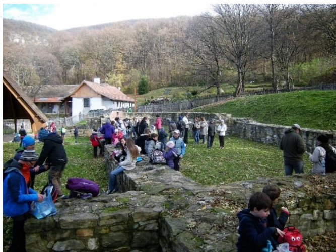
Hittanos kirándulás, Klastrompuszta