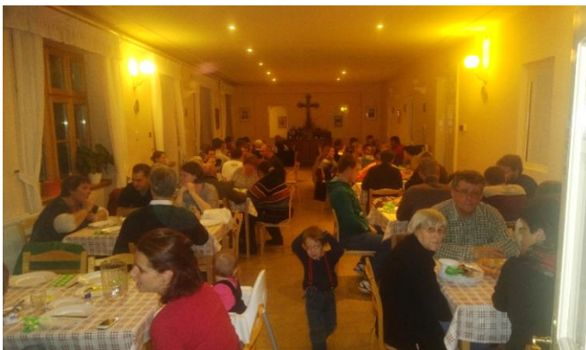
Vacsorához készülve a lelki gyakorlaton

Pénteken este a csillagos ég alatt mécsessel a kezünkben emlékeztünk Jézus szenvedés történetére. Az esti és reggeli imákat közösen végeztük a kápolnában, a zsolnározás ritmusára a napok során egyre jobban ráéreztem. A napi szentmisék egy-egy nap kiemelkedő eseményei voltak. Az előadások témái egymásra épültek, s az elhangzott tanítást kis csoportos megbeszélésben folytattuk. Az események felidézésén túl szeretnék néhány gondolatot, kérdést megosztani a testvérekkel, hiszen a péntek délutántól vasárnap délig tartó idő több emlékeztető élménnyel, gondolattal gazdagított.