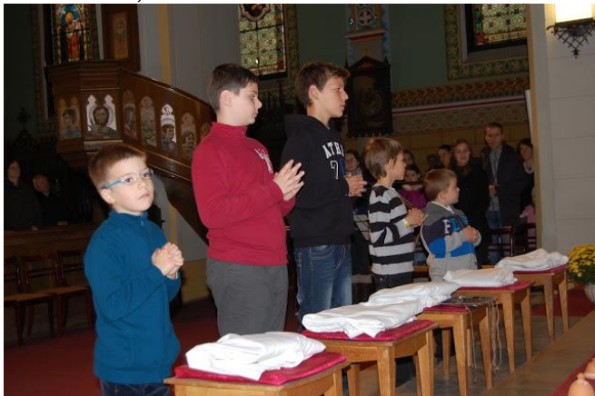
Ministráns avatás november 15, a beöltözés előtt