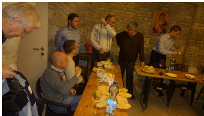
Készület a borkóstoló este plébániánk pincéjében