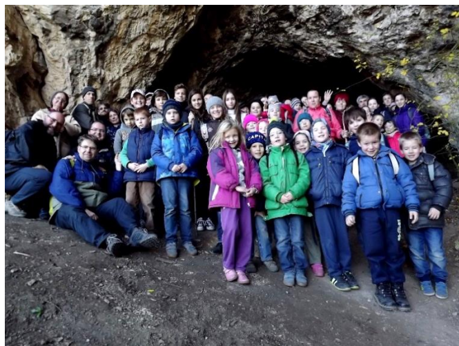
Hittanos kirándulás, Legény-barlang

aztán porzott a kiszáradt vízmosás szikkadt földje, és kopogott a falusi aszfalt, de leginkább a duruzsolás hallatszott, ahogy a menetelő és változó összetételű kiscsoportok jóízű beszélgetésekbe elegyedtek; voltak, akik most ismerkedtek, voltak, akik személyes, voltak, akik lelki témákat tárgyaltak, és voltak olyanok is, akik csak egyszerűen pletykáltak, vagy számítógépes játékokról beszélgettek (de ők nagyon kevesen voltak, sőt, ahogy most így visszaemlékszem, ilyen nem is volt), de minden beszélgetésben valahogy felmerült az az igen fontos téma, hogy „mikor érünk oda”, és aztán ez valahogy, szinte megmagyarázhatatlan módon meg is történt, mert odaértünk, ez tagadhatatlan, de mindez már akkor következett be, amikor talán immár nem is volt annyira fontos ez az „oda”, mert talán még mentünk volna, vagy ha nem is mentünk volna, de együtt azért még lettünk volna, ám rövid játszótérezés után indulnunk kellett a vasútállomásra, és a két kilométer úgy elröpült a lábunk alatt, mint ez az egész nap, és sajnáltuk, hogy vége lett.