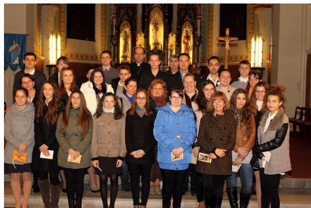
A 26 bérmálkozó csoportképe

A segítők is tartottak előadásokat, tanúságtételeket. Ezekből rengeteget lehetett tanulni, olyan dolgokat is meséltek, amelyek egyszerűen hihetetlenek, csodálatosak. Az estéinket játékokkal és vetélkedőkkel töltöttük. Sosem unatkoztunk: a dalolni vágyók gitáros és énekes próbát tartottak a misékre, a többiek addig pingpongoztak az udvaron. De később többen tartottunk pingpong partit! Jó hangulat jellemezte a hosszú hétvégénket. Az elején Zoltán atya elmondta, hogy ha pozitívan állunk ehhez az egészhez, akkor nagyon jó lehet. ha nem vesszük ki a részünket benne, akkor olyan élményekkel távozzunk. Hihetetlen nagy lelki feltöltődést jelentett számunkra a lelkigyakorlat. Jobban megismertük a minket körülvevő embereket és új emberekkel is tudtunk beszélgetni. Mindenkinek köszönjük, aki segített a felkészülésben!