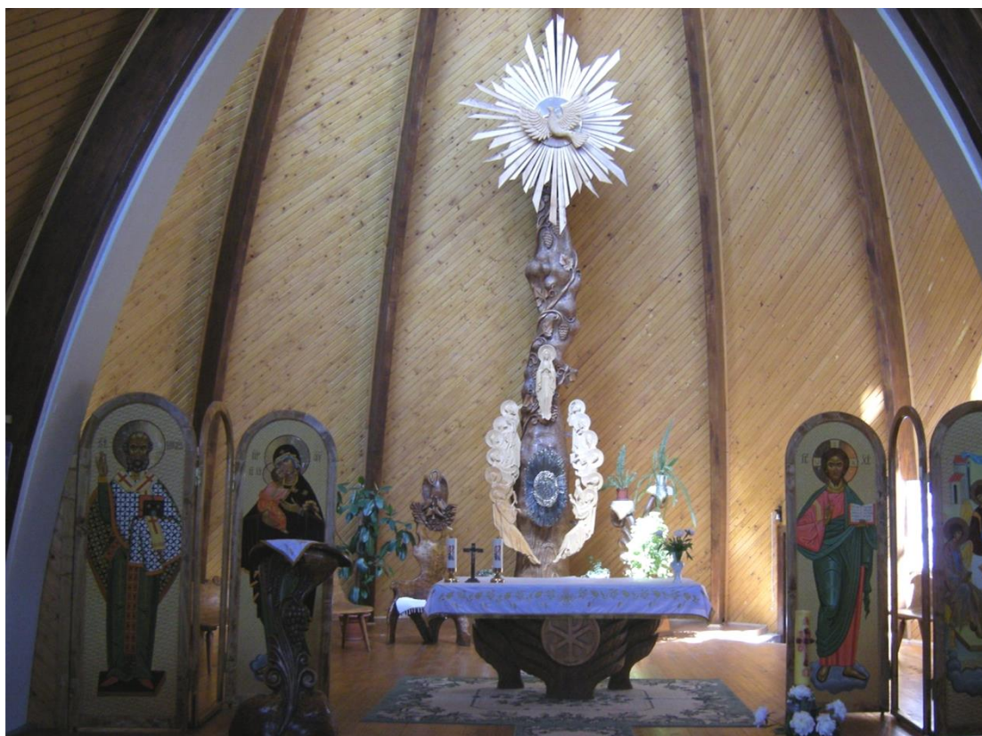
A csetfalvi templom szentélye