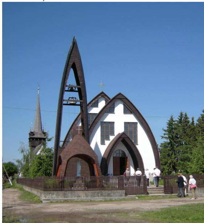
A csetfalvai katolikus templom, háttérben a műemlék református istenháza tornya.

Az érintetlen táj szépsége, a sok-sok műemlék, népi építészeti emlék. És ami mindezt betetézte, házigazdáink vendégszeretete Nagyborzsován. A szívüket is kítették, nem csak a finom ételeket.